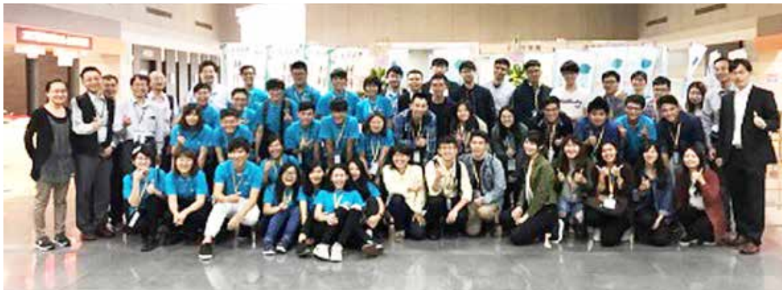
2017年國際亞洲材料大會剪影