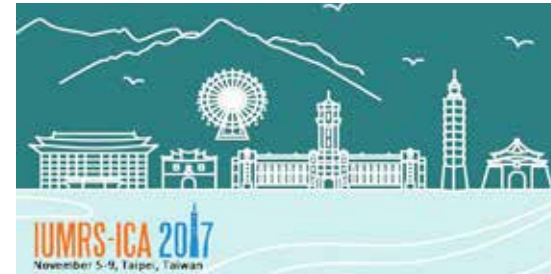
2017年國際亞洲材料大會一卡通

會議不同於往年的材料學會年會，是結合國際材料聯盟兩年一度舉行的材料國際會議，一併舉行國內最重要的材料科技學術會議，是一個互相交換經驗及交流的絕佳時機與最新研究成果的平台。2017年由本院材料系主辦，於11月13日至16日，假台北南港展覽館隆重舉行，活動總經費1千零8拾萬元，其中募款金額5萬元，共邀請了410位貴賓，與會人數計有1599人。全球參與國家包含歐美、日本、韓國、大陸、新加坡、泰國、澳門、香港等等，以及全國從事與材料研究相關的系所及研發單位與會，另外有近一千六百位國內外的教授及碩、博士班研究生與會，共同發表論文1179篇或聆聽演講，討論氣氛熱烈，獲得一致的好評。