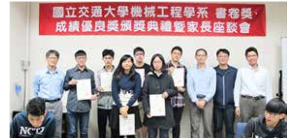
2017機械系家長座談會