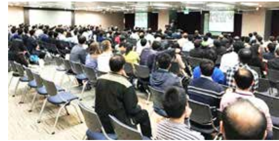
2017年國際亞洲材料大會剪影

國際亞洲材料大會(IUMRS-ICA 2017)是國際材料聯合學會最重要的系列會議之一。此