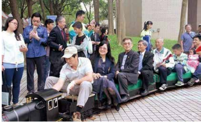
前校長及副校長開心試乘

長期以來承蒙各位校友、各界人士及各企業對本院的支持及認同，讓本院能持續穩健發展，您的每一分捐款，不論多寡，都能幫助我們達成目標，感謝您!!