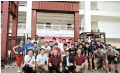
2016年全國竹塹抗震盃工作人員合影

由本院機械系自製的台灣第一輛迷你蒸氣火車(Mini-SL)，1/8比例與真車構造一模一樣，高度僅45公分，但動力卻足以乘載10多名大人快速奔馳，它可是台灣迷你蒸氣火車的鼻祖。今年欣逢上海、西安、西南、北京及新竹等五大校120週年校慶，本校在台60週年校慶，同時也是機械系40週年慶，本院機械系特地把台灣的首座阿公級迷你蒸氣火車再次復活，在校慶日再度亮相，大小朋友都爭相搶搭乘，也成為交大校慶一大賣點。