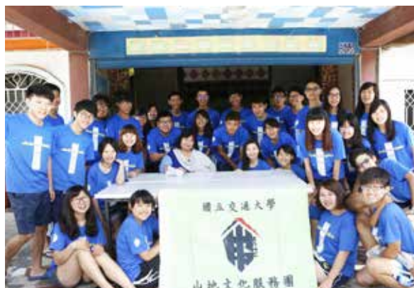
山地文化服務團暑期偏遠地區公益服務

生活輔導組本年度獲「朱順一合勤獎學金」等各項獎助學金捐款，共計673萬餘元，用以獎掖優秀學生及嘉勉清寒學生努力向學；「挺竹專案」累計捐款餘額243萬餘元，2017年補助學雜費3位學生計9萬餘元，使學生不因家長非自願性失業而影響就學權益；「學生急難濟助金」累計捐款餘額763萬餘元，2017年濟助17位學生計51萬元，使家庭突遭變故學生能安心就學。