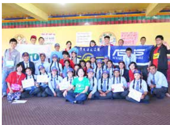
國際志工印度Jullay團學生數位工作坊合影

印度國際志工Jullay團本年度獲得華碩文教基金會補助10萬元與資策會補助4萬元，對於國際服務及成果發表有相當助益，其補助運用在設計印度Jamyang School學生多元化教學課程、辦理教師及學生數位工作坊、介紹離線資料庫系統Eneless OS，讓師生有更豐富的離線學習資源，並更新自學教材及協助多媒體視聽教室增加再生電腦數量。