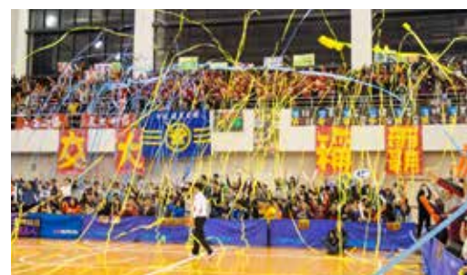
丁酉梅竹競技啦啦隊