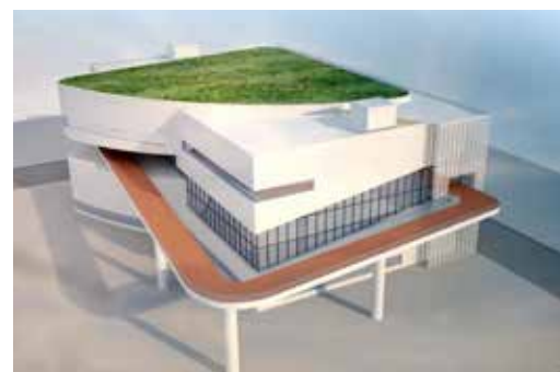
多功能運動中心3D模擬圖