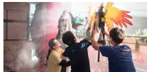
布袋戲社拍攝文創影片屢受肯定