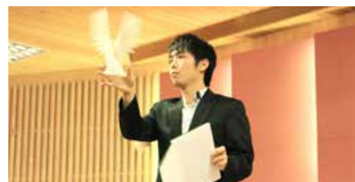
魔術社出鴿快手專業表演

課外活動組輔導學生社團本年度獲企業捐助總額33萬餘元，辦理偏遠地區中小學及弱勢團體公益課輔服務、魔術慈善晚會、2017第一屆新竹新創媒合派對、拍攝布袋戲文創影片等，藉由企業資源補助結合社團學生團體服務力量，前進偏遠地區執行在地關懷服務，促使社團同學從參與服務與貢獻中，分享服務與學習，並激發投入服務的持續力。