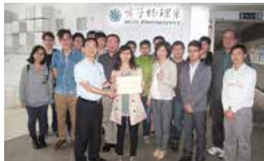
電物系友回母系座談並與壁報競賽同學及老師合影。