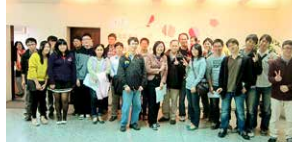
校慶應數系友回娘家活動

本所成立迄今邁入第23年，在有限的資源下，積極致力於基礎物理科學研究及培養下一代的物理科學研究人才。為了完成這些目標，期盼校友溫暖挹注，無論多少，對我們都是一項強力的支持。您的捐贈將會運用於(1)優秀東南亞國際學生獎學金：配合政府南向政策，尤其願意與企業建教合作，吸引頂尖東南亞學生入學及未來作為企業在東南亞的幹部。(2)研究生中短期出國進修旅費補助：專款專用每年補助3-5名學生到國際頂尖科學研究機構進行交換研究。(3)頂尖學生獎學金：提供目前現有本所現有獎學金制度之外的額外獎勵，作為吸引頂尖學生入學及就讀獎學金。我們尤其歡迎捐助人指定該筆款項的其他用途與研究領域，協助我們變得更強大更精彩。