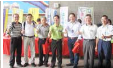
電物系慶活動系友回娘家並合影留念。