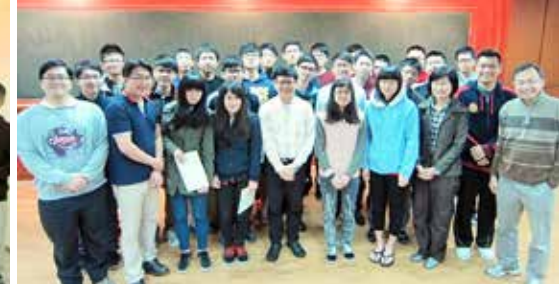
應數系數學書卷獎及數學特優獎學金頒獎活動