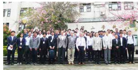
第三屆學習院大學-交通大學學生研討會

近年來「大數據」(Big Data)的運用，為我們的生活帶來全新的價值與創新。為培訓具備分析大數據能力的跨領域人才，本所結合本校資訊學院，開設「巨量資料分析」學程，並於106學年度合作成立「數據科學與工程研究所」，招收碩士班學生。學期中，我們舉辦一系列與業界的座談會，來分享他們在大數據上的作法與需求。我們亦主動爭取學生於暑期至這些企業實習的機會，藉此提升專業實務能力。我們鼓勵參與校外機構主辦的資料分析競賽，讓學生與不同學校、背景的參賽者互動、交流，表現優異者還有機會優先進入知名企業。我們的老師亦帶領學生，多方參與業界(包括：工研院、中華顧問工程司、IBM)的專案或計畫，與企業攜手合作，共同解決問題。這些作為，都在累積交大統計所在大數據領域的經驗與技術，期盼成為未來大數據分析的領導品牌。我們衷心邀期盼校友捐助，以提供本所於發展大數據領域所需部分經費。