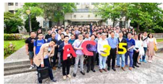
應化系「AC2017-應化35」系友回娘家活動