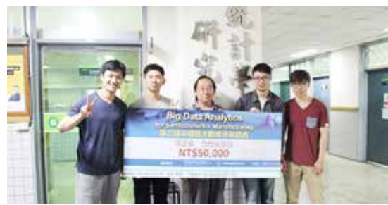
統計所學生參加台積電主辦的「第三屆半導體大數據分析競賽」，榮獲第三名佳績。

本系近年獲得的捐款主要用於研究所與大學部學生獎學金，部份的捐款用於碩博士班入學獎學金與系友相關活動。這幾年應化系經常舉辦不同領域的研討會。2017年11月，日本學習院大學師生共22人到交大應化系參加第三屆兩校學生的研究交流，這幾年的活動都很成功。因此2017年會在日本繼續舉辦第四屆兩校師生的學術交流活動。本系每年舉辦的系友回娘家活動，均邀請傑出系友與師生熱情參與並分享創業與工作心得。系友會每個月的定期的交大應化三二會也固定會有畢業系友與在學學生分享工作點滴，讓學弟妹了解產業現況。應化系的發展在系所同仁與系友的努力之下，已經成為台灣的重要研究與教學單位。感謝系友的支持，為應化系的發展努力。